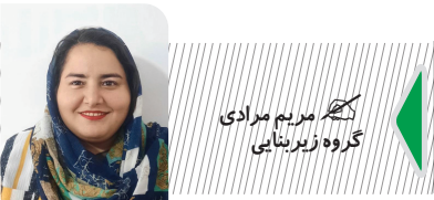
نگارگر: مریم مرادی گروه زیربنایی

مراودات یا کفتمان جدیدی به وجود آورد و در هر صورت ساختار و مراودات اصلی تغییر نمی‌کند. اگر در ادامه راه نیز اکثر اصول پیشبرد کشاورزی، بر بنیان ساختار قبلی باشد، یعنی اتفاق خاصی قرار نیست بیفتد. حق پژوه عملکرد کشاورزی در کشور را ضعیف ارزیابی کرد و گفت: اینکه هنوز این فکر وجود داشته باشد که برای خودکفایی یک راندمان تولید بسیار پایین یعنی یک تن در هکتار برای دیمزارها را حفظ کرد، اشتباه است. متوسط عملکرد دیمزارهای کشاورزی یک تن است. در کجای دنیا چنین عملکردی به عنوان برنامه توسعه‌ای در نظر گرفته می‌شود؟ اگر قرار است چنین اتفاقاتی ادامه‌دار باشد یعنی عزم درست در زمینه کشاورزی برای