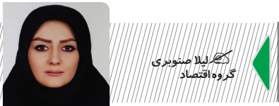
کترهلا صیامی گروه اقتصاد

مدیرکل دفتر آینه‌ی‌رویی وزارت اقتصاد و مؤلفه اصلی را برای تأمین منابع ناترازی‌های انرژی عنوان کرد و افزود: حساب بهینه‌سازی انرژی و حساب سرمایه‌گذاری در نفت و گاز دیده شده که برای هر کدام منابع مختلفی اندیشیده شده تا ما بتوانیم از طریق این حساب‌ها بخش زیادی از ناترازی‌ها و بهینه‌سازی بخش انرژی را تأکید بر فرآورده‌های نفتی را انجام بدهیم.