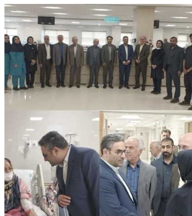
درمانی حضرت ابوالفضل(ع) در ساخت و تجهیز مرکز تخصصی و فوق تخصصی کلیه و دیالیز در خیابان امام

مهندسی تعمیرات با صرف ۵۰۰۰۰ نفر ساعت نیروی انسانی تخصصی یافته برای انجام و پشتیبانی، تعمیرات اساسی منطقه عملیاتی تنگ بیجار با موفقیت پایان یافت. وی با تقدیر از حمایت و پشتیبانی مدیریت شرکت گفت: این تعمیرات علیرغم وجود محدودیتهای زمانی، تجهیزاتی و متریالی، با برنامه ریزی مناسب، استفاده از همه امکانات و ظرفیتهای موجود در منطقه و تلاش شبانه روزی پرسنل در مدت زمان یک ماه انجام گرفته است. مهندس داری پور با تشریح مراحل انجام این پروژه گفت: تعویض و اصلاح بخشهایی از