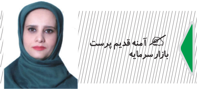
نگاره آینه قدیم پرست بازار سرمایه

گودرزی با بیان اینکه در سرشماری کشاورزی امسال تقریباً ۱۵ هزار نفر این سرشماری را انجام می‌دهند، ادامه داد: تقریباً ۶۰ درصد این نیروها در حوزه ثبت در استان‌ها و در سطح کشور پراکنده هستند