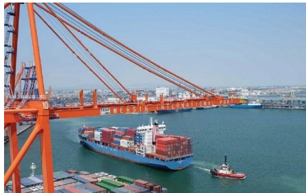
صادرات و واردات موضوع تصویب نامه شماره ۵۲۵۳ ت ۶۲۳۷۷ مورخ ۱۴۰۳/۲/۲۰ هیئت محترم وزیران در خصوص نحوه ترخیص کالاهای وارد شده

شرکت‌های واردکننده منتخب از شبهه ۲۱ مهرماه به صورت تدریجی نسبت به انجام فرایندهای واردات خودروی جانبازان اقدام می‌کنند. به گزارش خبرنگار مهر، بر اساس آنچه که سازمان توسعه تجارت ایران هفته پیش اعلام کرد شرکت‌های منتخب این سازمان از