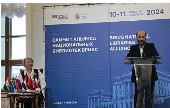
رئیس سازمان اسناد و کتابخانه ملی ایران گفت: کتابخانه های ملی می توانند با تقویت روابط فرهنگی و علمی بین ملت ها یک نقش کلیدی در دیپلماسی فرهنگی ایفا کنند به گزارش ایرنا از روابط عمومی سازمان اسناد و کتابخانه ملی ایران، غلامرضا امیرخانی در اجلاس روسای کتابخانه های ملی کشورهای بریکس که در مسکو برگزار شد، با تأکید بر نقش کتابخانه های ملی به عنوان پل های ارتباطی فرهنگی اظهار داشت: کتابخانه های ملی به دلیل ماهیت بی طرفانه خود، می توانند به تقویت روابط فرهنگی و علمی بین ملت ها کمک کنند و نقشی کلیدی در دیپلماسی فرهنگی ایفا کنند. وی با اشاره به پیشینه درخشان تمدن های کشورهای عضو بریکس افزود: میراث با شکوه فرهنگی، علمی و هنری این کشورها، از مصر باستان، دساتوردهای علمی چین در صنعت کاغذ و چاپ تا کتابخانه های تاریخی هند و نسخه های خطی نفیس نگهداری شده در کتابخانه های کشورهای نظیر ترکیه، ایران و امارات متحده عربی و میراث غنی اسلامی در منطقه غرب آسیا و اروپا، همگی شواهدی از پیشتاری کشورهای عضو بریکس در عرصه کتاب و میراث مکتوب بشری است. امیرخانی پیشنهادهایی برای گسترش همکاری های فرهنگی میان کشورهای عضو بریکس مطرح کرد و گفت: برگزاری نمایشگاه ها و هفته های فرهنگی مشترک، تبادل منابع علمی و اطلاعاتی و راه اندازی بخش های فرهنگی در کتابخانه های ملی برای معرفی و ترجمه متون ادبی ملی، می تواند گام های مؤثری در ارتقای هم افزایی

روسیه، هند، چین، آفریقای جنوبی، مصر، اتیوپی، امارات متحده عربی و ایران است. این سازمان که در ابتدا برای برجسته سازی فرصت های سرمایه گذاری شکل گرفت، به شکل یک بلوک ژئوپلیتیک تکامل پیدا کرد و از سال ۲۰۰۹ دولت های عضو آن سالانه نشست های رسمی برگزار می کنند و سیاست های چند جانبه را با هم هماهنگ می کنند روابط میان اعضای بریکس عمدتاً بر اساس عدم مداخله، برابری و یاری متقابل انجام می شود. مجموع اعضای این سازمان حدود ۴۵ درصد توان اقتصادی دنیا را شکل می دهد. غلامرضا امیرخانی رئیس سازمان اسناد و کتابخانه ملی ایران برای شرکت در نشست روسای کتابخانه های ملی کشورهای عضو بریکس (BRICS) سفر کرده است. این سفر در پاسخ به دعوت وادیم دودا رئیس کتابخانه دولتی روسیه با هدف تبادل نظر، پرامون ظرفیت های فرهنگی و علمی کشورهای عضو بریکس و بررسی ابتکارات کتابخانه ای در زمینه راه اندازی پایگاه های داده مشترک و ارائه خدمات دیجیتال فراگیر به کاربران انجام شده است. امیرخانی در کنار حضور در دو نشست چند جانبه، با هدف تقویت روابط علمی و فرهنگی با روسیه، از کتابخانه ملی آرشو ملی و کتابخانه دولتی این کشور بازدید می کند. رئیس سازمان همچنین در دیدارهای دوجانبه با رؤسای کتابخانه های ملی کشورهای بریکس از جمله اسامه طلعت رئیس آرشو و کتابخانه ملی مصر، آجای پراتاپ سینگ رئیس کتابخانه ملی هند، عبدالله ماجد رئیس آرشو و کتابخانه ملی امارات متحده عربی و کپی مادومو رئیس کتابخانه ملی آفریقای جنوبی به گفتگو خواهد پرداخت.