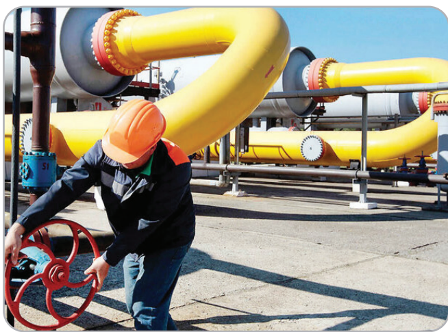
ایران و ترکمنستان نیاز به زمان‌بندی دارد و تاکنون اقدام‌هایی انجام شده است. با ترکمنستان و روسیه منعقد شده است، اجرای قرارداد گازی خاطر نشان کرد.

این مقام مسئول در رابطه با وضعیت تأمین سوخت نیروگاه‌ها در زمستان اضافه کرد: با توجه به اینکه مصرف گاز در زمستان در بخش‌های خانگی و تجاری روند صعودی دارد اما استفاده از سوخت مازوت هم آلودگی هوا را به دنبال دارد، تلاش می‌کنیم زمستان امسال با تکمیل تعمیرات و ذخیره‌سازی مطلوب گاز مایع از سوی شرکت ملی پالایش و پخش فرآورده‌های