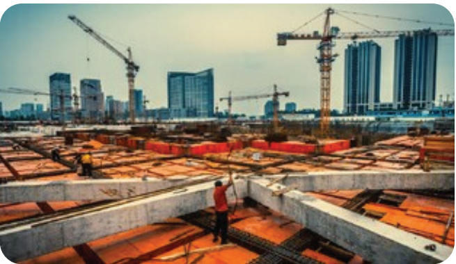
دست و پنجه نرم می‌کند و یو افزود: بر اساس آمار تحولات بازار مسکن که بانک مرکزی طی روزهای اخیر منتشر کرده، منطقه ۵ و سپس