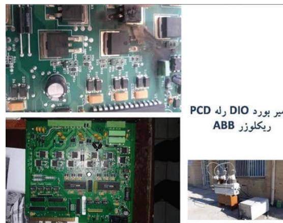
مدیر بورد DIO رله PCD ریکولوزر ABB

مدیر دفتر نظارت بر بهره برداری با بیان اینکه هزینه جایگزینی یک دستگاه