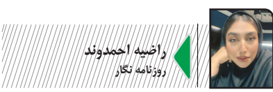
زاهیه احمدوند روزنامه نگار

عروج ملکوتی حضرت آیت‌الله العظمی امام خاضنه‌ای (قدس‌الله نفسه الزکیه)، فقدانی عظیم و غمی سترگ بر پیکره امت اسلامی و جان یکایک ایرانیان است. ایشان در مقام حکیمی فرزانه، قیپهی زمان‌شناس و رهبری دوراندیش، نه‌تنها برچمدار عدالت و کرامت در جهان اسلام، که تجسم عینی استقامت در برابر جبهه استکبار بودند. آن رهبر شهید، با نگاهی تملن‌ساز، آفق‌های دوری را برای اعتلای ایران اسلامی ترسیم کردند و با تکیه بر درایت کم‌نظیر و اشراف جامع بر مسائل جهان، همواره نقطه نقل وحدت و فصل‌الخطاب جریان‌های فکری بودند. مجاهدت‌های بی‌وقفه و خستگی‌ناپذیر ایشان در مسیر اعتلای توحید و دفاع از مظلومان و آزادگان جهان خواهد ماند و نامشان در اوراق زرین تاریخ، به عنوانِ شخصیتی تاریخ‌ساز و بی‌بدیل، حک خواهد شد.