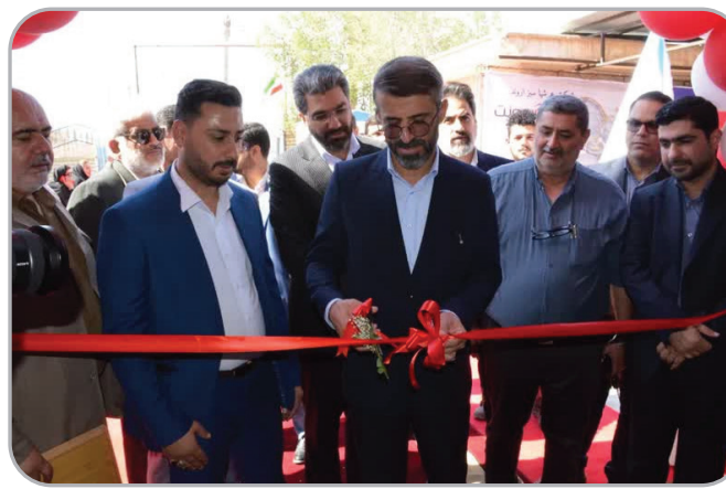
نفر و با ظرفیت تولید ۲ هزار تن در سال شهرک صنعتی آبادان به بهره برداری یکی از این ۳ واحد تولیدی بود که در رسیدوی افزود: همچنین شرکت پرتیا

مدیرعامل سازمان منطقه آزاد اروند گفت: همزمان با گرامی داشت هفته دفاع مقدس و سالروز شکست حصر آبادان، سه طرح تولیدی با سرمایه‌گذاری بالغ بر ۳۳۶ میلیارد تومان توسط بخش خصوصی در شهرک های صنعتی آبادان و خرمشهر به بهره‌برداری رسید. به گزارش روابط عمومی و امور بین الملل سازمان منطقه آزاد اروند، علی زارعی در آیین بهره‌برداری از این پروژه‌ها ضمن اشاره به اینکه با احداث و راه‌اندازی این سه واحد کوچک و متوسط تولیدی برای ۵۳ نفر به صورت مستقیم شغل ایجاد شده است، اظهار داشت: شرکت عرشیا سبز اروند با راه‌اندازی خط تولید ظروف شیشه‌ای با بالغ بر ۲۸ میلیارد تومان سرمایه‌گذاری داخلی و اشتغالزایی ۲۵