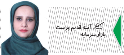
نگار آینه قدیم پرست بازار سرمایه