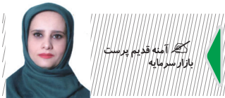
کیا آینه‌فردمهرست بازار سرمایه