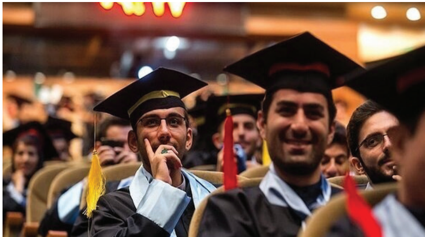
را در فضاهای مختلف چه در داخل و چه خارج بررسی می‌کند.

دستیار ویژه رئیس بنیاد ملی نخبگان در امور مستعدان و آینده‌سازان بنیاد ادامه داد: آماري که بنیاد نخبگان در خصوص مهاجرت با شاخصه‌های مدنظر به دست آمده،