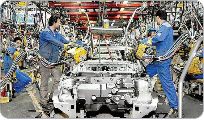
صنعت تأیر را درآورده است. در همین خصوص متأسفانه به دلیل سواستفاده برخی

برخلاف تذکر و تاکیدات رهبری مبنی بر استفاده از ظرفیت‌های داخلی و تقویت تولید ملی، برخی از جریان‌های دلال صفت با استفاده از لابی‌های پشت پرده و خلل قوانین و غفلت برخی از مسئولان به دنبال تأمین منافع خود در قالب افزایش واردات هستند. به گزارش جهان اقتصاد به نقل از خط بازار؛ برخلاف تذکر و تاکیدات رهبری مبنی بر استفاده از ظرفیت‌های داخلی و تقویت تولید ملی، برخی از جریان‌های دلال صفت با استفاده از لابی‌های پشت پرده و خلل قوانین و غفلت برخی از مسئولان به دنبال تأمین منافع خود در قالب افزایش واردات هستند. یکی از مصداق‌های امر واردات بی‌رویه و ضدتولید تأیر است که صدای تولیدکنندگان