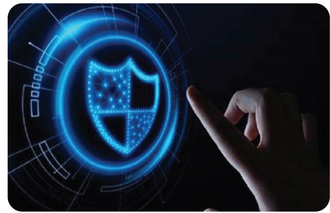
در حالیکه شش شرکت بزرگ سایبری دنیا برای ترمیم ده‌ها ضعف امنیتی محصولات خود، به‌روزرسانی عرضه کرده‌اند، مهاجمان همچنان در حال سوءاستفاده از ۲۶

آسیب‌پذیری هستند. به‌گزارش خبرگزاری مهر به نقل از مرکز مدیریت راهبردی افتا، شرکت‌های مایکروسافت، سیسکو، فورتی‌نت، سولاریندز، گوگل و موزیلا آخرین به‌روزرسانی امنیتی را در شهریورماه عرضه کردند تا حدود ۱۵۰ آسیب‌پذیری امنیتی محصولات خود را ترمیم کنند اما سازمان امنیت سایبری و زیرساخت آمریکا (CISA) می‌گوید که مهاجمان سایبری در حال سوءاستفاده از ۲۶ آسیب‌پذیری هستند، ضمن اینکه برخی سامانه‌های کنترل صنعتی نیز در خطر نفوذ مهاجمان قرار گرفته‌اند. اطلاعات فنی و تکمیلی و همچنین مشخصات آسیب‌پذیری محصولات شش شرکت بزرگ سایبری دنیا در پایگاه اینترنتی مرکز مدیریت راهبردی