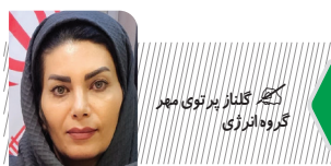
رئیس سازمان انرژی های اتمی

تابستان ها نیز به این مشکل افزوده است، به طوری که مصرف آب به رکوردهای بی سابقه ای رسیده است. علاوه بر این، تابستان امسال گرمای بی سابقه ای در تهران ثبت شد که دمای هوا به ۴۳ درجه سلسیوس رسید و این گرما حتی تا اوایل شهریورماه ادامه یافت. تأثیر این گرما باعث افزایش شدید مصرف آب شده، به طوری که مصرف روزانه آب شهروندان تهرانی به چهار میلیون مترمکعب و یک لختی مصرف به ۶۰ هزار لیتر بر ثانیه رسید. به طور کلی باید گفت که با افزایش جمعیت و پیامدهای گسترده ای برای ساکنان این منطقه به همراه داشته است. این مشکل چندین عامل