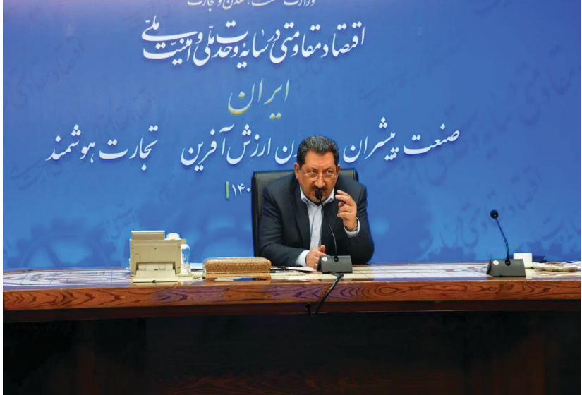
وزیر صنعت، معدن و تجارت

به گفته وی در سال گذشته بیشترین ارز برای خودرو