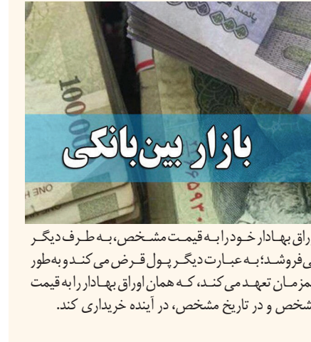
بازار بین بانکی

به گزارش تسنن، بر اساس داده‌های بانک مرکزی نرخ بهره بین بانکی در پایان هفته چهارم آذر ماه سال جاری (چهارشنبه ۲۸ آذر ماه) نسبت به هفته قبل از آن با جهش ۰.۷ درصدی به ۲۳.۹۳ درصد رسید و این میزان بالاترین میزان نرخ بهره بین بانکی از ابتدای سال جاری تا هفته چهارم آذر ماه است. اخیراً نرخ بهره بین بانکی در ابتدای آبان ماه (دوم