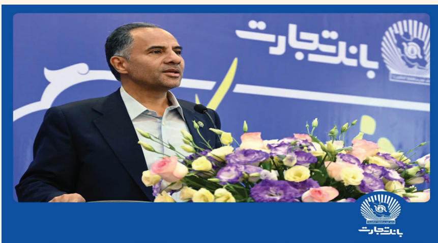
مدیرعامل بانک تجارت در آستانه ۲۹ آذر، سالروز تاسیس این بانک، با تبریک این مناسبت خجسته به همکاران شاغل،

بازنستگان، مشتریان و سهامداران ارجمند، بر ضرورت تداوم رویکرد نوآوری، توسعه و ارائه محصولات و خدمات نوین و ارزش آفرین برای مشتریان عزیز، تأکید کرد. به گزارش مدیریت روابط عمومی و ارتقای سرمایه اجتماعی بانک تجارت، متن پیام دکتر هادی اخلاقی فیض آثار به این شرح است. با سپری شدن واپسین روزهای پاییز سال ۱۴۰۳ و در آستانه فرارسیدن یلدای مهر و عطوفت ایرانیان عزیز، ضمن تبریک بیست و نهم آذر، سالروز تاسیس بانک وزین و خوشنام تجارت، پیشاپیش، یلدای مبارک و شاد را برای همه هموطنان عزیز، مشتریان و سهامداران ارجمند و همکاران گرامی شاغل و بازنشسته آرزو مندم. متفخرم در چهارمین سال توفیق حضورم در جمع خانواده بزرگ بانک تجارت، به استحضار برسانم با عنایات الهی و متاثر از اتخاذ سیاست ها و برنامه های اصولی و مدون، متناسب با شرایط اقتصادی و فضای رقابتی کشور و همچنین با بهره گیری مناسب از فرصت ها و مزایای رقابتی بانک که به همت و تلاش یکایک