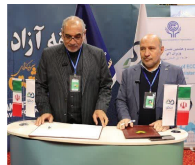
تفاهم نامه «ملات لجستیک ایران» بین منطقه ویژه اقتصادی سرخس در خراسان رضوی و منطقه آزاد ماکو در آذربایجان غربی امروز سه شنبه در حاشیه اجلاس وزرا خارجه کشورهای عضو آکوبه امضا شد. به گزارش پایگاه خبری منطقه آزاد ماکو، این تفاهم نامه