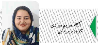
سید فرخ میرشاهزاد گردشگری

قوانین و مقررات دست و پاگیر نیز مانع از رشد صنعت گردشگری است. گردشگری حساس ترین و ترسوترین صنعت خدماتی دنیا است. زمینه ترس در این حوزه در کشور مهیاست. اختلافات منطقه‌ای تنش‌های بین المللی باعث می‌شود که گردشگر علی‌رغم اینکه ایران به لحاظ اقتصادی مقرون به صرفه است، حاضر به ورود به ایران نیست. زیر از یک طرف احساس امنیت نمی‌کنند و از طرف دیگر خدمات مناسبی دریافت نمی‌کنند. گردشگران داخلی نیز به دلیل مشکلات اقتصادی اثن می‌کنند هزینه‌ها را به شدت پایین آورند. در نتیجه در چادر ساکن می‌شوند یا غذایشان را خودشان تهیه می‌کنند و از رستوران‌ها و هتل استفاده نمی‌کنند. در نتیجه شتاب رشد گردشگری در کشور بسیار پایین است.