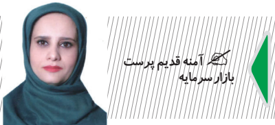
نگار آینه قدیم پرست بازار سردمایه

معاون نظارت مرکز بازرگانی و تنظیم بازار وزارت جهاد کشاورزی تصریح کرد: توزیع نهاده‌ها در ۲ سال گذشته افزایش داشته و قیمت آن نیز حتی کاهش یافته است. وقتی قیمت نهاده پایین آمده و میزان توزیع آن افزایش پیدا کرده است باید نرخ دام زنده کاهش شود. چرا قیمت دام زنده تا ۲ سال گذشته بالا بود و چند ماه گذشته که کاهش پیدا کردیم با تنظیم قیمت آن را پایین بیاوریم نرخ دام زنده را کاهش داده‌اند. به اندازه‌ای که نهاده گرفته‌اند و دولت برای آن‌ها هزینه کرده است باید قیمت دام زنده را پایین بیاورند و واردات را در این بفرمایند عرضه می‌کنند در حالی که می‌توان نیاز بازار گوشت را از داخل تأمین کرد.