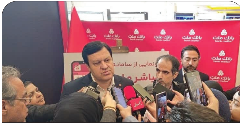
برنامه کاربردی (اپلیکیشن) مباشر ویژه مشتریان حقوقی و شرکت ها، با حضور مدیرعامل بانک ملت، همزمان با

یازدهمین همایش و نمایشگاه بانکداری نوین و نظام های پرداخت، به صورت رسمی رونمایی شد. به گزارش روابط عمومی بانک ملت، در این مراسم که با حضور فرسید فرخ نژاد مدیرعامل بانک ملت، جمعی از مدیران ارشد این بانک و اصحاب رسانه برگزار شد، اپلیکیشن مباشر به صورت رسمی رونمایی و قابلیت های آن برای حاضران تبیین شد. بر اساس این گزارش، بانک ملت با طراحی و تولید اپلیکیشن مباشر سعی کرده است تا دسترسی به خدمات بانکی را برای مشتریان حقوقی تسهیل کند و با استفاده از این اپلیکیشن گزارش های کلان و مهم مربوط به حساب های ریالی و ارزی مشتریان حقوقی و همچنین تسهیلات و تعهدات شرکت را در اختیار مدیران و کاربران منتخب این شرکت ها قرار دهد.