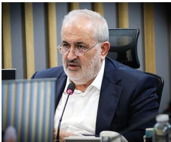
وزیر نیرو با بیان اینکه در حال حاضر ۹۷ درصد انرژی برق مورد نیاز کشور در حال تامین است، گفت: فقط سه درصد از نیاز برق کشور از طریق اعمال