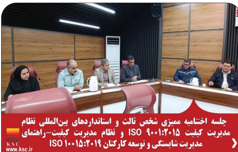
جلسه اختتامیه ممیزی شخص ثالث و استانداردهای بین المللی نظام مدیریت کیفیت ISO ۹۰۰۱:۲۰۱۵ و نظام مدیریت کیفیت - راهنمای مدیریت شایستگی و توسعه کارکنان ISO ۱۰۰۱۵:۲۰۱۹

تهدیه با محوریت شایستگی ها در فرآیندهای جذب، انتصاب، ارتقا و آموزش کارکنان، شجاعت سازمان را در اقدام به پیاده سازی الزامات این استاندارد ستود. وی همچنین از نگرش مدیران ارشد سازمان در خصوص