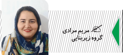
گروه زیربنایی گروه زیربنایی