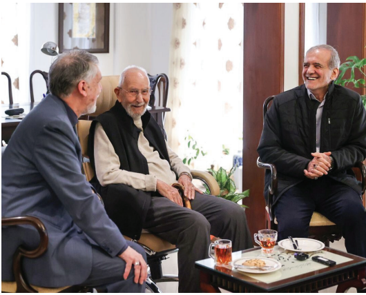
کتاب آراجمه استاد محمد به نام با قافله شوق دربرگیرنده مجموعه مقالاتی از دوستان، همکاران و شاگردان وی درباره زندگی و آثار موحد، در دانشگاه تبریز توسط محمد

طاهری خسروشاهی، از محققان حوزه ادبیات فارسی در آذربایجان، تدوین و منتشر شده است. موحد در زمینه مسایل حقوقی نیز صاحب نظر بوده و دو کتاب «درس های از داورهای نفتی» و «نفت و مسائل حقوقی آن» به عنوان کتاب درسی در دوره کارشناسی ارشد حقوق تجارت به عنوان منبع درسی معرفی شده است. محمدعلی موحد نخستین بار مسایل حقوقی نفت را وارد متون درسی دانشگاه کرد. در پژوهش های تاریخی نیز دکتر موحد با کتاب چهار گانه «خواب آشفته نفت» اثری مهم و ماندگار را از خود بجای گذاشته است. سی و دومین دوره هفته کتاب جمهوری اسلامی ایران با شعار «خواندن برای همدلی» از چهارشنبه ۲۳ آبان آغاز شده و تا ۳۰ آبان ادامه خواهد داشت. مراسم هفته کتاب با مشارکت و همکاری وزارت فرهنگ و ارشاد اسلامی، وزارت آموزش و پرورش، وزارت علوم، تحقیقات و فناوری، وزارت کشور، وزارت جهاد کشاورزی، وزارت بهداشت، درمان و آموزش پزشکی، سازمان تبلیغات اسلامی، هیات امنای کتابخانه های عمومی، سازمان صدا و سیما، شهرداری ها، کانون پرورش فکری کودکان و نوجوانان، حوزه های علمیه، دانشگاه ها، جهاد دانشگاهی، هیات امنای مساجد، سازمان تربیت بدنی، مولفان، موسسات نشر و کتابفروشی ها برگزار می شود.