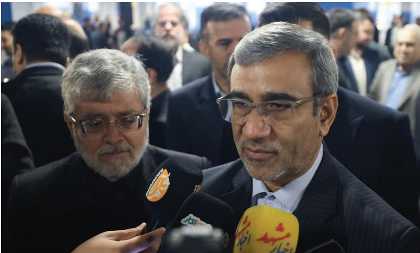
شهری با کارکرد ملی و بین‌المللی است، اما دارآمدهای آن محدود

به منابع محلی است. برای اجرای طرح‌های بزرگ زیرساختی مانند احداث پارکینگ‌های چندطبقه و توسعه سیستم حمل‌ونقل عمومی، به حمایت جدی دولت نیاز داریم. استاندار خراسان رضوی به تجربیات موفق گذشته اشاره و خاطر نشان کرد: در دولت‌های قبلی، پروژه‌های مهمی مانند ساخت صحن حضرت معصومه (س) واحداث چهار هزار پارکینگ در اطراف حرم مطهر