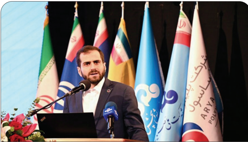
مدیریت پایداری در سطح بین‌المللی منجر شود.