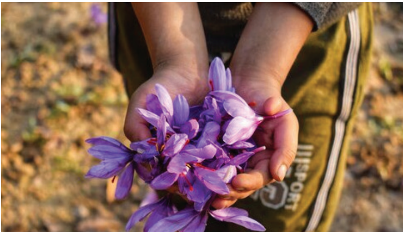
کشورهای دارای پیشینه تولید زعفران، کشورهایمانند بلغارستان، مجارستان، تاجیکستان، قرقیزستان، آذربایجان،

که ایران چگونه می‌تواند سهم بازار خود را حفظ کند، گفت: دغدغه کشاورز باید رفع شود؛ ضمن اینکه صنایع تبدیلی باید رشد کند.