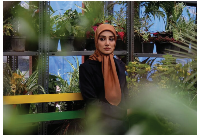
۴۲ قسمت پخش شده و طبق برنامه‌ریزی‌ها، ۱۶ قسمت دیگر «ناریا» که جدیدترین اثر تا پایان داستان باقی مانده است.