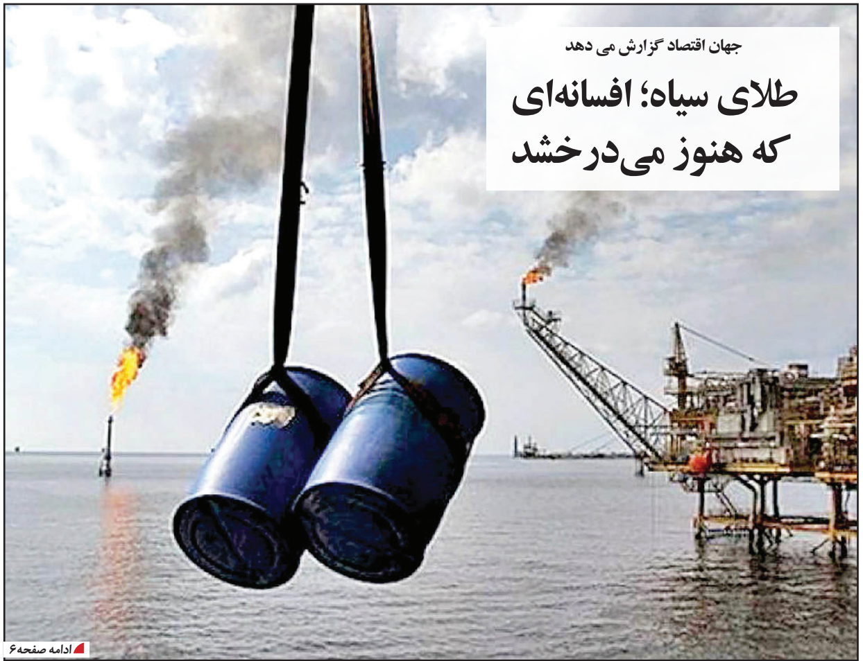
جهان اقتصاد گزارش می دهد

همیشه به شکل اصولی و پایدار صورت نگرفته است. در واقع، بسیاری از این کشورها به دلیل مدیریت ناکارآمد، فساد ساختاری و عدم توجه به آینده نگری، نتوانسته اند از فرصت های طلایی بهره برداری اصولی از معادن بهره مند نشده اند. بلکه با تخریب محیط زیست، اتلاف منابع و وابستگی بیش از حد به نفت، راه توسعه پایدار را مسدود کرده اند.