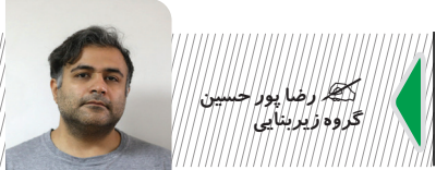
کobra زینتی گروه زیربنایی

جهان اقتصاد: افزایش چند برابری عوارض‌های شهرداری و سازمان‌های خدمات‌رسان بدون شک قیمت تمام شده مسکن را تقویت خواهد کرد. اما قیمت‌های اعلامی از سوی سازندگان و فروشندگان نسبت به سال گذشته تغییر محسوسی نداشته و در مواردی کاهش نیز یافته است. انطور که واسطه‌های ملکی می‌گویند به رسم معمول با نزدیک شدن به هفته‌های پایانی سال، میزان مراجعات به بنگاه‌های املاک و تمایل برای خرید آبار نماند در مقایسه با ماه‌های قبل افزایش نسبی در دهه افزایشی که به گفته نایب رئیس اول اتحادیه مشاوران املاک به هیچ عنوان با رشد قیمت همراه نیست.