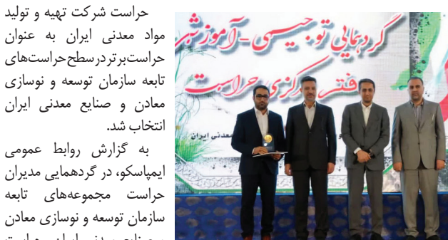
حراست برتر در سطح حراست‌های تابعه سازمان توسعه و نوسازی معادن و صنایع معدنی ایران انتخاب شد.

به گزارش روابط عمومی ایمپاسکو، در گردهمایی مدیران حراست مجموعه‌های تابعه سازمان توسعه و نوسازی معادن و صنایع معدنی ایران، حراست تهیه و تولید مواد معدنی ایران به عنوان حراست برتر انتخاب و مورد تجلیل قرار گرفت.