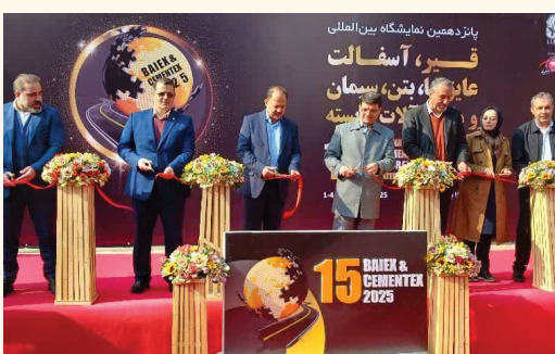
پانزدهمین نمایشگاه بین المللی قیر، آسفالت، سیمان و بتن، عایق ها و ماشین آلات وابسته با حضور و مشارکت ده ها شرکت دانش بنیان در این نمایشگاه خبر داد و گفت: این شرکت ها ضمن ارائه نوین ترین طرح ها و دست یافته های خود، چندین محصول جدید نیز در نمایشگاه رونمایی کنند.