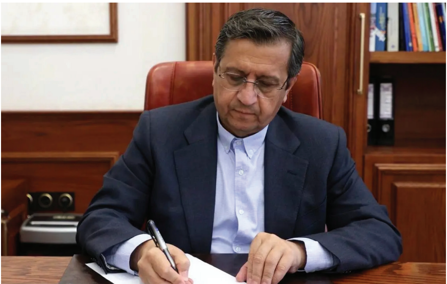
جهان اقتصاد: وزیر امور اقتصادی و دارایی با ارسال نامه‌ای به پنج وزیر، آمادگی خود را برای

ارایه تضامین دولتی به طرح‌های اقتصادی بخش غیر دولتی اعلام کرد. جهان اقتصاد: وزیر امور اقتصادی و دارایی با ارسال نامه‌ای به پنج وزیر، آمادگی خود را برای