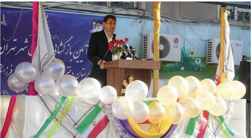
آموزش ضروری است افراد متناسب با نوع توانایی‌شان، آموزش‌های متفاوتی دریافت کنند و ابزارهای نوین و به‌طور مشخص هوش مصنوعی می‌تواند در این مسیر مؤثر باشد.