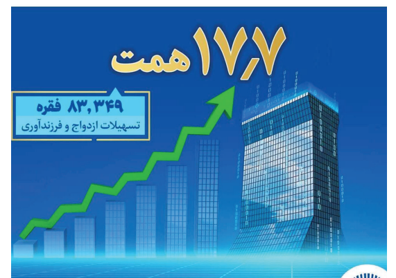
پیشتازی بانک تجارت در اعطای تسهیلات ازدواج و فرزند آ

بانک تجارت در راستای تسهیل فرایند ازدواج زوج های جوان، از ابتدای امسال تا پایان شهریورماه بیش از ۴۲ هزار فقره تسهیلات قرض الحسنه ازدواج و بیش از ۴۰ هزار فقره تسهیلات فرزندآوری پرداخت کرد تا جایگاه نخست خود در بین دیگر بانک های کشور را تحکیم کند.