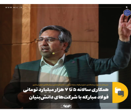
همکاری سالانه ۵ تا ۷ هزار میلیارد تومانی فولاد مبارکه با شرکت‌های دانش‌بنیان