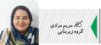
کobra زینبانی گروه زیربنایی

اما اگر سرمایه گذاری زمین را به صورت قانونی خریداری کرده است، جزو حقوق فرد است و دولت اجازه ندارد دخالتی در آن داشته باشد. وی در ادامه افزود: اینکه بعضی از افراد سرمایه خود را به خرید زمین اختصاص داده اند، ربطی به خانه دار کردن افراد کم بضاعت و کم توان اقتصادی ندارد. دولت باید زمین ها و اراضی خود را در اختیار جامعه بگذارد. علاوه بر این باید برای افراد کم بضاعت جامعه ای افرادی که درآمد کافی ندارند، مسکن تهیه کند. از طرح مسکن ملی دولت ۳ سال است که گذشته است. این طرح وارد سال چهارم خود شده است. دو سال و نیم این طرح در دولت سیزدهم بود. چند ماهی است که دولت چهاردهم مستقر شده است. اما این طرح به نتیجه مطلوبی نرسیده است. این کارشناس مسکن معطای زمین به مردم را بی فایده خواند و گفت: در دولت سیزدهم اعلام شد که به مردم