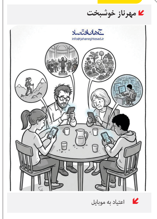
اعتیاد به موبایل