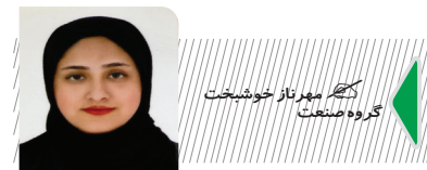
مجری طرح توسعه گوهرسنگ کشور گردش مالی بازارهای جهانی فلزات گرانبهارا سالانه ۱۲۰۰ میلیارد دلار در سال خوانده اعلام کرد

مجری طرح توسعه گوهرسنگ کشور گردش مالی بازارهای جهانی فلزات گرانبهارا سالانه ۱۲۰۰ میلیارد دلار در سال خوانده اعلام کرد. کشور در این گردش مالی تنها ۲ صدم درصد است و وی چالش های بزرگ این صنعت را عدم ورود گوهرسنگ خام به کشور و معضل در ورود این به نمایشگاه های بین المللی جواهرات نامید.