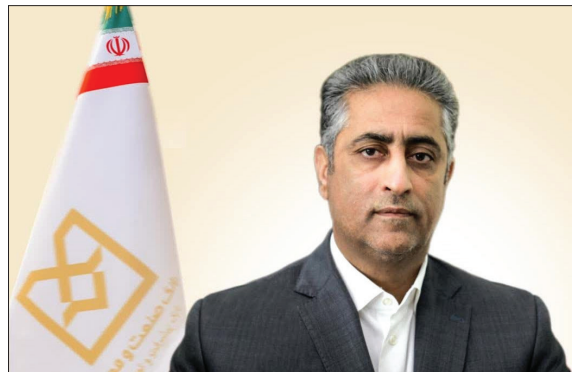
وزیر امور اقتصادی و دارایی، طی حکمی دکتر محمود شایان را به سمت مدیرعامل بانک صنعت و معدن منصوب کرد.

به گزارش روابط عمومی بانک صنعت و معدن، در حکم انتصاب وی آمده است: "نظر به تعهد، سوابق و تجربیات جنابعالی و پیرو حکم شماره ۱۴۸۷۱۷/۶۰ مورخ ۱۶/۰۳/۱۴۰۳ و به استناد ماده (۲۵) دستورالعمل الزامات حاکمیت شرکتی در بانک‌های دولتی منصوب مجمع عمومی بانک‌ها و با عنایت به مصوبه مورخ ۱۶/۰۳/۱۴۰۳ هیات مدیره بانک صنعت و معدن به موجب این حکم به سمت مدیرعامل بانک صنعت و معدن منصوب می‌شوید. امید است با اتکال به خداوند و با رعایت منشور اخلاقی کارکنان دولت چهاردهم در تحقق اهداف دولت، حل مشکلات و نیل به موارد زیر مجتهدانه بکوشید: ۱- هدایت اعتبارات به سمت بخش‌های مولد اقتصاد به ویژه در زمینه ایجاد، توسعه، نوسازی و بهسازی واحدهای صنعتی و معدنی متناسب با اولویت‌های توسعه‌ای کشور ۲- اصلاح ساختار مالی بانک به ویژه از طریق افزایش خالص درآمدهای عملیاتی