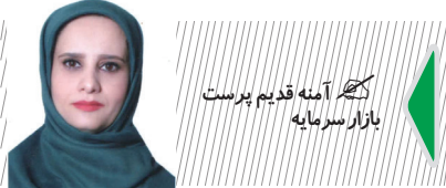
کتبه آینه قدیم پرست بازار سرمایه

با نزدیک شدن به ایام کریسمس انواع و اقسام تبلیغات در فضای مجازی و یا از طریق پیامک برای مخاطبان ارسال می‌شود. تبلیغاتی که در خوش بینانه ترنی حالت کمتر از ۲۰ میلیون تومان نبوده و وعده انواع اقسام برنامه‌های تفریحی را می‌دهد. اما این نکته زمانی حائز اهمیت می‌شود که مخاطبان این تبلیغات افراد متوسط و رده بالای جامعه را هدف قرار داده و اکثریت جامعه که با کف حقوق مشغول به زندگی هستند در خوش بینانه ترین حالت باید بدون حتی یک ریال خرج کرده حقوق ۲ ماه خود را پرداخت کنند تا بتوانند تنها به اندازه یک نفر جا در این تورهای فریبنده رزرو کنند. حتی اگر بخواهیم از هزینه‌های سفر بگذریم، موضوعی که نموداشکری از شکاف طبقاتی در جامعه ایران است.