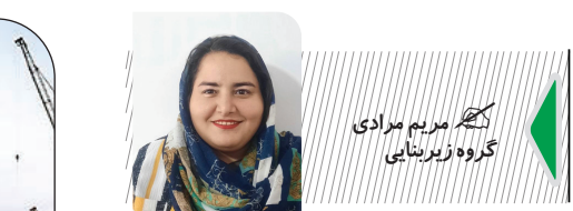
گروه زیربنایی گلریم مریم مرادی

لذا به منظور اطلاع عموم مراتب در دو نوبت به فاصله ی ۱۵ روز آگهی می شود. در صورتیکه اشخاص نسبت به صدور سند مالکیت متقاضی اعتراضی داشته باشند می توانند طرف مدت دو ماه و در مورد آگهی های اصلاحی طرف مدت یک ماه از تاریخ انتشار اولین آگهی اعتراض خود را به این اداره تسلیم و پس از اخذ رسید طرف مدت یک ماه از تاریخ تسلیم اعتراض دادخواست خود را به مراجع قضایی تقدیم نمایند. بدیهی است در صورت انقضای مدت مذکور و عدم وصول اعتراض طبق مقررات سند مالکیت صادر خواهد شد. تاریخ انتشار نوبت اول: ۱۴۰۳/۰۸/۲۳ تاریخ انتشار نوبت دوم: ۱۴۰۳/۰۹/۰۸ جلیل تیموریان- رئیس اداره ثبت اسناد و املاک منطقه دو ایلام