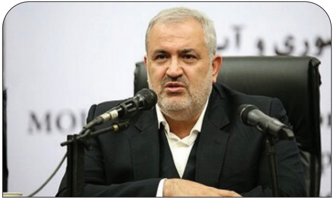
آب و برق وارد شده‌ام و انتظار دارم نمایندگان خانه ملت برای برون رفت از چالش‌ها و مشکلات پیش‌روی این

صنعت در کنار وزارت نیرو قرار گیرند. وی یادآور شد: برنامه‌های ارائه شده برای صنعت آب و برق در ابتدای دولت