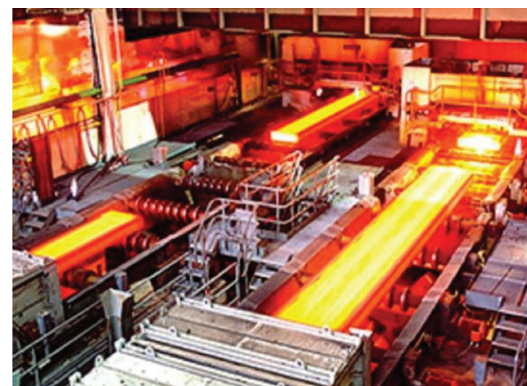
در آخرین رده‌بندی عرضه‌ی شمش فولادی در بورس کالا کشور، شرکت فولاد خوزستان به تتهایی و بی‌اعتنا به محدودیت‌های انرژی جایگاه نخست را

به خود اختصاص داد و بار دیگر ثابت کرد، موفقیت اتفاقی نیست و به عواملی فراتر از سخت‌افزارها بستگی دارد. معامله بیش از ۹۰۰ هزار تن در بورس کالای در نه ماهه نخست سال، به معنای شناسایی کامل نیازهای بازار و مشتریان داخلی است.