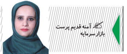
بازار سرمایه کجای آینه قدیم پرست

بر اساس این گزارش دولت سیزدهم پس از یک سال تأخیر آیین‌نامه واردات خودروهای کارکرده را در آخرین روزهای فعالیت خود ابلاغ کرد. مصوبه‌ای که فارغ از شتابان‌دگی تصویب آن در مجلس به نظر می‌رسد تنها برای رفع تکلیف و انداختن بار اجرای آن بر دوش دولت چهاردهم ابلاغ شد. حال با تبدیل شدن این موضوع به مطالبه مردم وزیر صمت از لزوم اصلاح آیین‌نامه خبر داده است در این رابطه محمد اتایک، وزیر صمت هفته گذشته با حضور در نشست