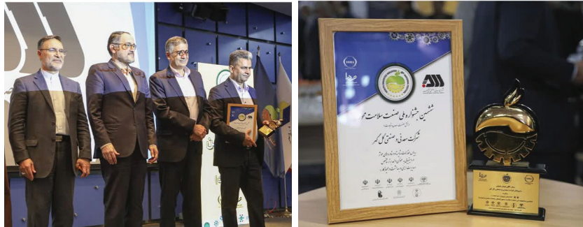
ارقای سلامت صنایع کشور و معرفی سازمان‌های پاسخگو و مسئولیت پذیر در حوزه سلامت برگزار شد، نشان زرین دو ستاره را دریافت کرد و عنوان واحد برتر

شاخص "مدیریت ایمنی و بهداشت در محیط کار" را به خود اختصاص داد. این نشان و عنوان ارزشمند پس از بررسی مستندات و بازدید میدانی همکاران جشنواره، به شرکت معدنی و صنعتی گل گهر اعطا شد. لازم به ذکر است در پنجمین دوره این جشنواره نیز شرکت گل گهر موفق به نشان زرین تک ستاره شده بود که در سال جاری با ارتقاء نسبت به سال قبل موفق