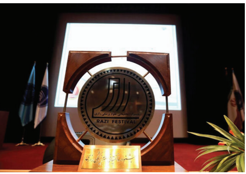
تاکنون پنج دوره آن برگزار شده است و در محققین برجسته در این حوزه مورد تقدیر قرار خواهند گرفت.

وی خاطر نشان کرد: با توجه به اینکه جوایز جشنواره افزایش داده ایم، ما به دنبال کاهش هستیم تا جوایز بیشتری تقدیم پژوهشگران برگزیده کنیم. معاون تحقیقات و فناوری گفت: در ۳۰ دوره برگزاری جشنواره تحقیقاتی رازی حداقل ۲۰ جشنواره با حضور رئیس جمهور برگزار شده است و ما امیدواریم جشنواره امسال نیز با حضور دکتر پزشکیان در خانه خود، وزارت بهداشت برگزار شود.