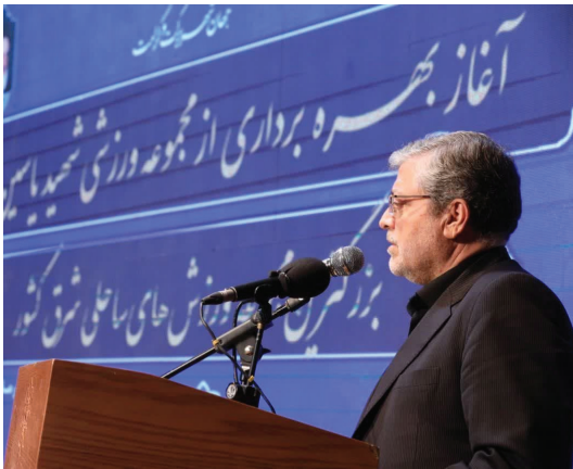
خبرنگار سیمیه بزاززاده - خبرنگار جهان اقتصاد شهردار مشهد با اشاره به احداث مجموعه ورزشی بزرگ بازی‌های ساحلی گفت:

در این دوره جهش خوبی در حوزه توسعه زیرساخت‌های ورزشی داشته‌ایم. محمدحاضر قلندر شریف در مراسم افتتاح مجموعه بزرگ ورزشی بازی‌های ساحلی شهید یاسین رحیمی که با حضور استاندار خراسان رضوی، رئیس و جمعی از اعضای شورای اسلامی شهر و مدیران شهری و استانی برگزار شد افزود: امروز یکی از روزهای خوب برای مشهد به ویژه در نقاط کم برخوردار بوده و خوشحالم که امروز لیکن در لبان مردم و کودکان این منطقه نشانه شده است. وی با بیان اینکه ایجاد حس و حال خوب برای زائران و مجاوران مشهد در دستور کار این دوره مدیریت شهری قرار گرفت اظهار کرد: هم‌راهی خوبی در حوزه فرهنگی و اجتماعی و شورای شهر صورت گرفته و از ابتدای دوره، ۱۰ درصد بودجه شهرداری به این حوزه اختصاص یافته است. شهردار مشهد اضافه کرد: هر چند وظیفه سازمانی و تعریف شده‌ای در حوزه ورزش نداریم اما به این حوزه همیشه توجه ویژه می‌کرده‌ایم. قلندر شریف تصریح کرد: خوشبختانه در این حوزه جهش خوبی در ایجاد و توسعه زیرساخت‌ها داشته‌ایم و مجموعه‌های ورزشی خوبی در این دوره تحویل مردم شده است. وی با اشاره به اینکه مجموعه‌های ورزشی در حوزه روپاز و سالن‌ها امکانات بسیار خوبی دارد اظهار کرد: یکی از زیرساخت‌های ورزشی ایجاد شده در این دوره، مجموعه‌های آبی بسیار پیشرفته شهید قربانی