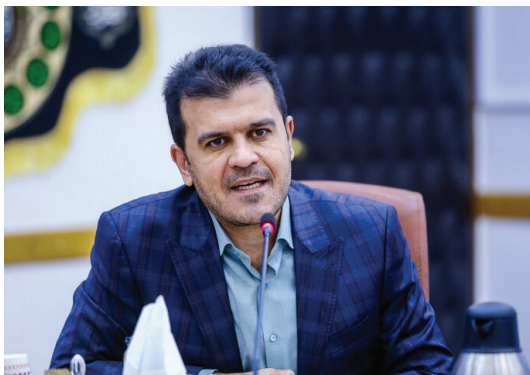
وی با اشاره به ابعاد شخصیتی و مدیریتی دکتر رضا روستا آزاد گفت: ایشان هم معاون پژوهشی دانشگاه شریف و در یک بازه زمانی دیگر رئیس دانشگاه بودند.

وی همچنین در خصوص ادغام این جوایز برای برگزاری بهتر آنها گفت: تعریف این دو جایزه متفاوت است و این جوایز را نمی توان با یکدیگر ادغام کرد. اجازه بدهید یکی دو دوره جایزه روستا آزاد برگزار شود و اگر امکان پذیر بود، تغییری برای آن اندیشیده خواهد شد.