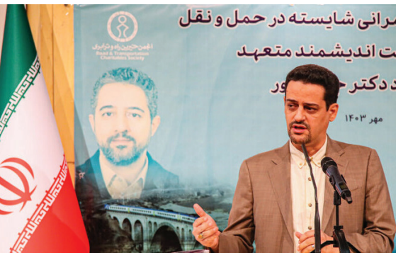
برانی شایسته در حمل و نقل

معاون برنامه ریزی و مدیریت منابع وزیر راه و شهرسازی گفت: ظرفیت هایی که برای حوزه حمل و نقل در برنامه هفتم توسعه فراهم شده، بی سابقه است. به گزارش خبرگزاری مهر، امیر محمود غفاری معاون برنامه ریزی و مدیریت منابع وزیر راه و شهرسازی گفت: امروز حمل و نقل ستون فقرات جهانی است و طبق آمار ۱۱ درصد تولید ناخالص داخلی را حمل و نقل به خود اختصاص می دهد و اگر مباحث اجتماعی و سیاسی آن را هم محاسبه کنیم، حمل و نقل یکی از ستون های مدیریت جهانی است. وی با اشاره به بر خورداری ایران از چهار شقوق حمل و نقل افزود: شبکه مسیره ای هوایی ایران وسیع است و کشور ما حدود ۲۷۰۰ کیلومتر مرز دریایی، ۱۷ هزار کیلومتر خطوط ریلی و شبکه جاده ای گسترده دارد که استفاده حداکثری از این شبکه عظیم حمل و نقلی نشده است و جای کار دارد. معاون وزیر راه و شهرسازی با بیان اینکه نیازی نیست که همه موارد را به بودجه عمرانی کشور گره بزنیم، گفت: بالغ بر دو