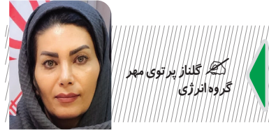
کاتون گلزار پرنوی مهر گروه انرژی

جهان اقتصاد در سال های اخیر مصرف انرژی و به ویژه سوخت های نظیر بنزین به یکی از چالش های مهم کشورها تبدیل شده است. در ایران تلاش های زیادی برای بهینه سازی مصرف بنزین انجام شده و ایده هایی برای کنترل مصرف و افزایش عدالت در توزیع منابع انرژی مطرح شده است. یکی از این ایده ها، طرح تخصیص بنزین به هر کد ملی به جای هر خودرو بود که با موافقت برخی از مجلس نشینان و پیگیری دولت سیزدهم در حال بررسی بود که به صورت آزمایشی در جزیره کیش اجرا شد. اما این طرح، به دلیل مواجهه با نقاط ضعف ساختاری و اجرایی با شکست روبرو شد و باز خورد های مثبتی به دنبال نداشت.