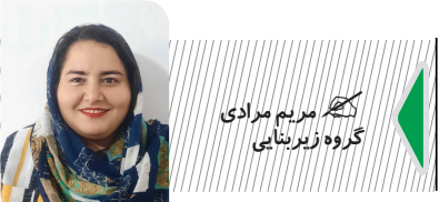
کobra زیربنایی گروه زیربنایی