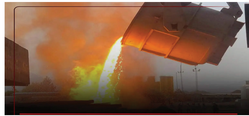
مدیرعامل ایریتک یکپارچگی مستمر در ارتباط با جلب همکاری شرکت‌دائیلی در پروژه فولادسازی و نورد قروه کردستان به منظور