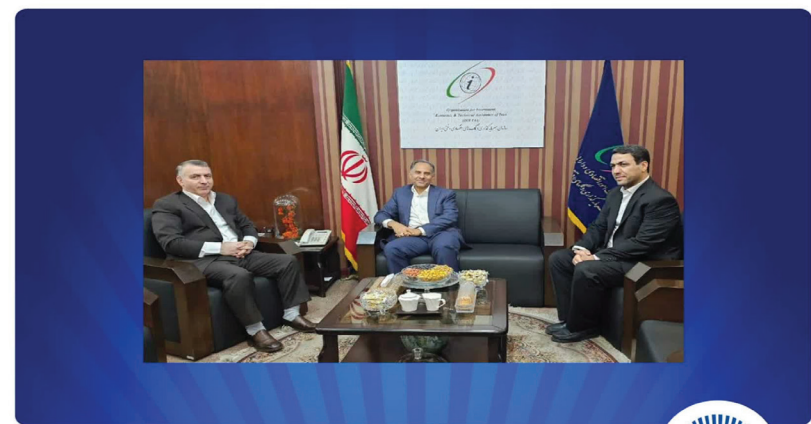
دیدار دکتر اخلاقی با معاون وزیر امور اقتصادی و دارایی و سرپرست سازمان سرمایه‌گذاری و کمک‌های اقتصادی و فنی ایران

مدیرعامل بانک تجارت سال‌ها تجربه این بانک در حوزه عملیات ارزی را یادآوری کرد و گفت: به پشتوانه این تجربه، بانک تجارت افتخار دارد که طی سال‌های اخیر رتبه نخست صدور ضمانتنامه، گشایش اعتبار اسنادی و حجم عملیات ارزی بین شبکه بانکی کشور را حفظ کرده و همواره جایگاه خود را ارتقاء داده است.