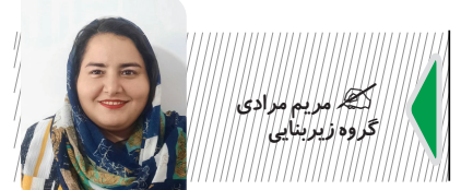
کاترین زینبایی رئیس سازمان هواپیمایی کشوری

از سه بندر تردد دیگری انجام نمی شد. معاون امور دریایی سازمان بنادر و دریانوردی عنوان کرد: همان زمان نیز بیانیه اعتراض آمیزی در این خصوص تهیه و ابلاغ کردیم. وی در ادامه گفت: کشورها اروپایی از هر بهانه ای استفاده کردند برای اینکه نتوانند صنعت حمل و نقل کشور ما را چه هوایی چه دریایی تحت فشار قرار دهند و تحریم کنند. این فشارها نمی تواند دولت ایران را متوقف کند. ایران هم استقبال کرد و در حال انجام اقدامات لازم برای آن هستیم که امیدواریم خط تحریم اعمال می کند. معاون امور دریایی سازمان بنادر و دریانوردی به اینکه