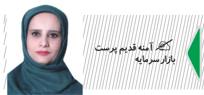
کلیه آینه قدیم پرست بازار سرمایه

دولت نسبت به بازار سرمایه با مدت مشابه سال های قبل به طور چشمگیری تغییر کرده و علائم این تغییر را می توان در کاهش بهره مالکانه معادن، تسعیر ارزش صنایع با ارز توافقی و حذف دلار نیما، کاهش نرخ اخزا و ثبات نرخ های سپرده مشاهده کرد.