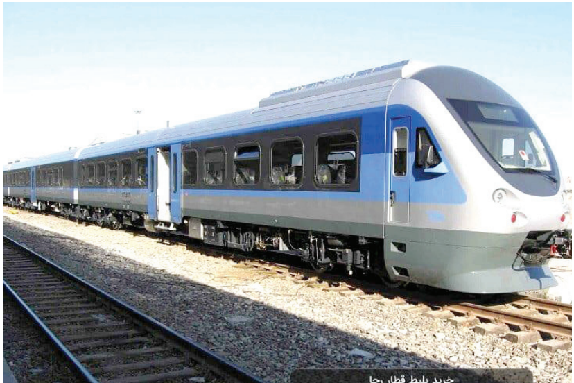
خرید ریلوود قضا

بالای ۳۲ سال دارند نباید از شبکه جابه‌جایی مسافر خارج شوند؟ گفت: واگن‌های بالای ۳۰ سال طی مقررات خاص تدوین شده توسط راه‌آهن، در دو سطح یک و دو بازسازی می‌شوند. در واقع این واگن‌ها تحت فرایند بازسازی قرار می‌گیرند و کل اقلام و قطعات آنها تعویض و نوسازی می‌شود. بنابراین اینگونه نیست که عمر آنها زیاد شود و تغییری نکنند و همچنان به سیر ادامه دهند.