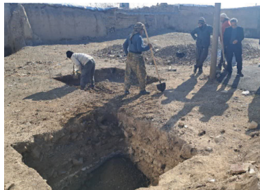
قلمه کار ارزشمندی است که شهرداری نهاوند آغاز کرده است و در نهایت منجر به احیای یکی از مهمترین آثار باستانی کشور و در نهایت رونق گردشگری در منطقه می شود.

جانجان با بیان اینکه قلمه تاریخی نهاوند یک یادآوری از توان نظامی و نوآوری های معماری تمدن هایی است که در این منطقه ساکن بودند، گفت: این اثر باستانی همچنین یک یادآوری از تاریخ پر نوسان ایران به ویژه در دوران ساسانیان و اوایل اسلام است. به گفته سرپرست تیم کاوش قلمه تاریخی نهاوند بازسازی این