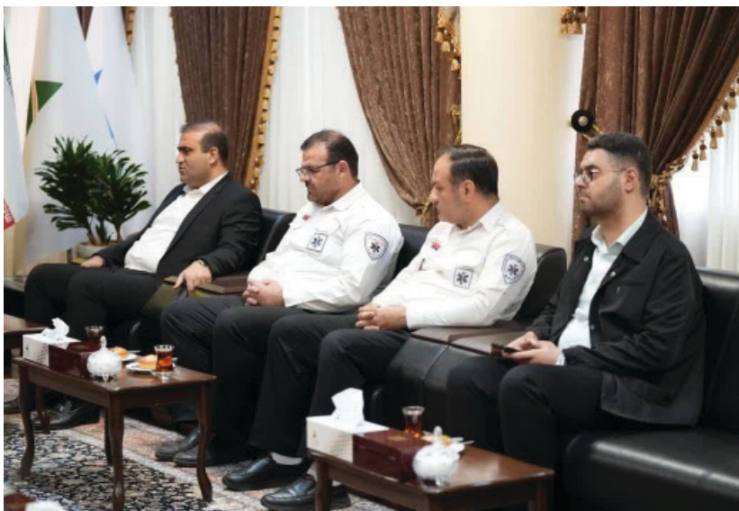
و مسافران قرار دارد. استمرار توسعه گردشگری بدون تقویت خدمات امدادی ممکن نیست و ارس برای ارائه

وی همچنین با اشاره به رشد مستمر سفرها و حضور گسترده گردشگران در منطقه آزاد ارس، نقش اورژانس را در تأمین ایمنی و آرامش مسافران بسیار مهم توصیف کرد و گفت: اورژانس در خط مقدم حفظ جان شهروندان