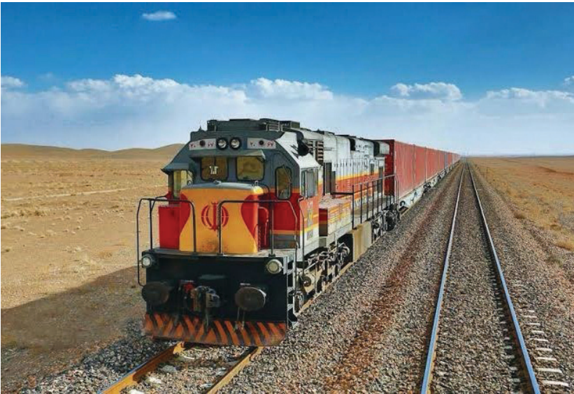
تفاهمنامه باقی مانده‌اند.

علاوه بر این، صنعت ریلی مدرن به فناوری‌های پیشرفته نیاز دارد که عمدتاً در اختیار شرکت‌های اروپایی، آمریکایی یا چینی قرار دارد. تحریریه نه تنها واردات مستقیم این فناوری‌ها را مسدود کرده، بلکه حتی مسیرهای دور زدن تحریم را پرهزینه، ناکارآمد و پرریسک ساخته است. تجربه این وضعیت، فرسودگی ناوگان ریلی کشور است. تعداد لوکوموتوهای فعال به مراتب کمتر از نیاز واقعی است و بسیاری از واگن‌ها نیز فراتر از عمر مفید خود در حال سرویس‌دهی هستند. این مسئله مستقیماً بر ظرفیت حمل بار از بنادر تأثیر می‌گذارد و امکان افزایش چشمگیر سهم ریلی را از بین می‌برد.