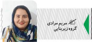
کیمبر برآمدی گروه زیربنایی

به خاطر افزایش قیمت ها اثرگذاری وام ۹۶۰ میلیون تومانی خرید مسکن در حال کاهش است. امروز با این وام می توان ۸۳ متر مسکن در تهران خریداری کرد. گزارشی که سال گذشته منتشر شد نشان داد بانک های متخلف به دلیل عدم پرداخت تسهیلات مسکن مرتب جرم شدند و باید ۲۶ هزار میلیارد تومان به سازمان امور مالیاتی پرداخت می کردند. هر چند معلوم نیست آیا این جریمه دریافت شده است. در حال حاضر افراد توان گرفتن چنین وامی را ندارند و بانکها هم نمی توانند به علت ناترازی وام پرداخت کنند. حتی اگر وامی هم پرداخت شود، برای خرید مسکن کافی نخواهد بود. وام باید بتواند حداقل سهم ۵۰ درصدی از مبلغ یک خانه را پوشش دهد در حالی که حداکثر وام داده شده در تهران، برای پوشش دهی یک سوم یک خانه ۴۰ هتری نیز کافی نیست. مطابق آخرین گزارش بانک مرکزی در مرداد ۱۴۰۳، متوسط قیمت مسکن به ازای هر متر مربع به ۸۸ میلیون و ۵۰۰ هزار تومان رسید. وام خرید مسکن از محل اوراق حق تقدم مسکن (تسه) برای زوجین تهرانی ۸۰۰ میلیون تومان و با احتساب وام تعمیر (جمله)، ۹۶۰ میلیون تومان است. متقاضیان برای دریافت این وام باید معادل دو برابر رقم وام یعنی ۱۹۲۰ برگ اوراق حق تقدم وام مسکن (تسه) را خریداری کنند بررسی معاملات نشان می دهد قیمت هر برگ حدود